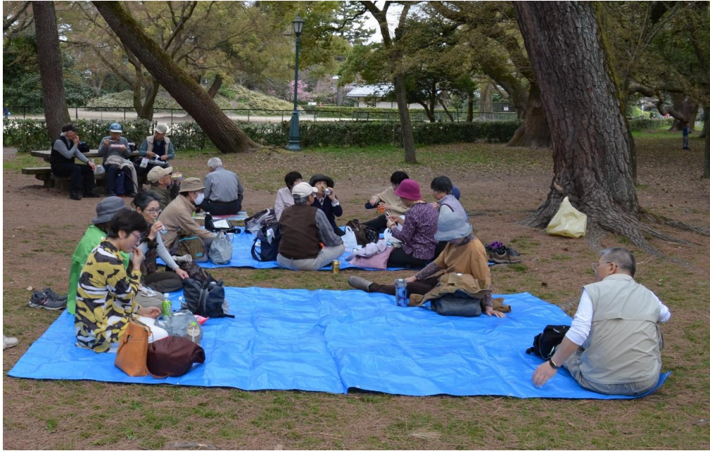
③ 出水の小川付近での昼食