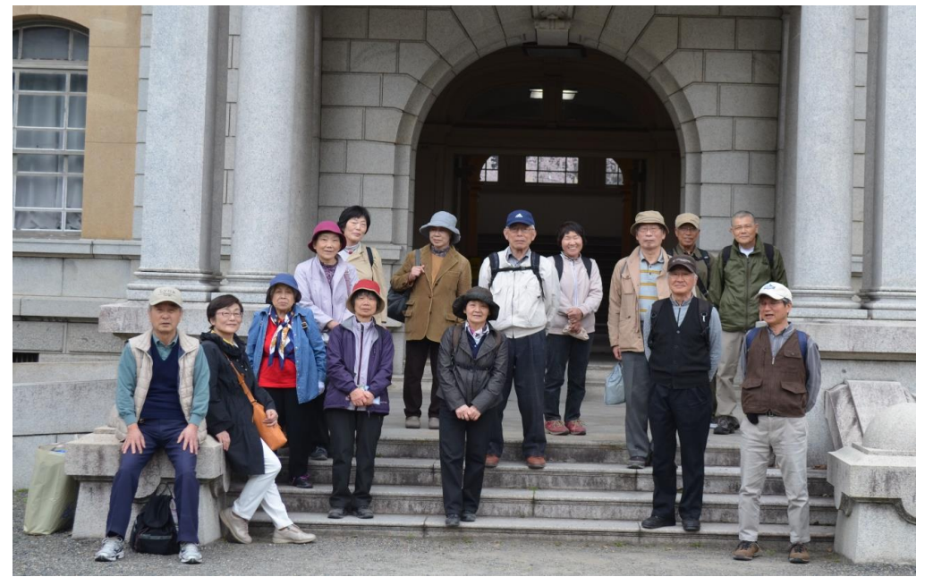
⑦ 京都府庁旧本館前