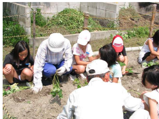
サツマイモ苗の植え付けの様子 (7/14)