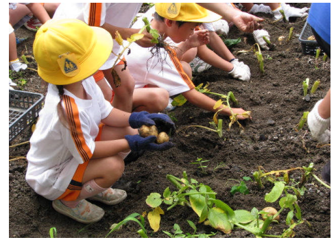
1年生のジャガイモ収穫

6月23日、一年生にはジャガイモの収穫を、4年生にはサツマイモ苗の植え付けを、6年生には5年生の秋に苗を植えた玉ねぎの収穫をそれぞれ体験してもらいました。