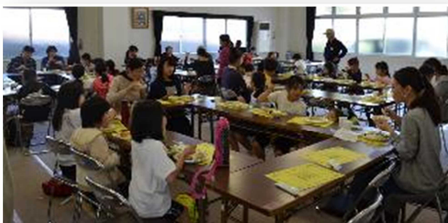
子ども食堂の様子

少子高齢化の進む日吉台ですが、このように子どもから大人までみんなが参加する幅広い活動こそが元気なまちづくりではないかと思えます。今後若い人たちがスタッフに参加していただける事を願っています。