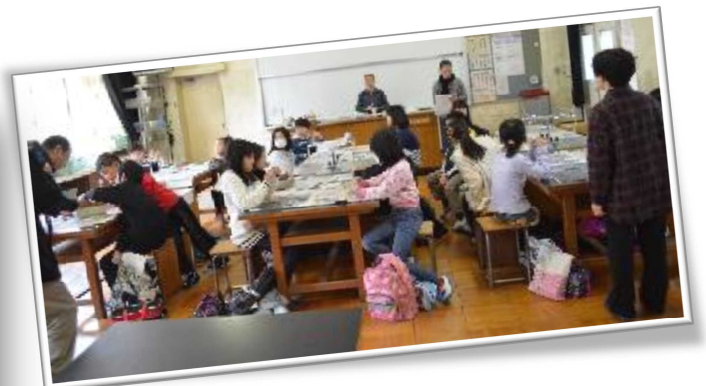
寺子屋プロジェクトの様子