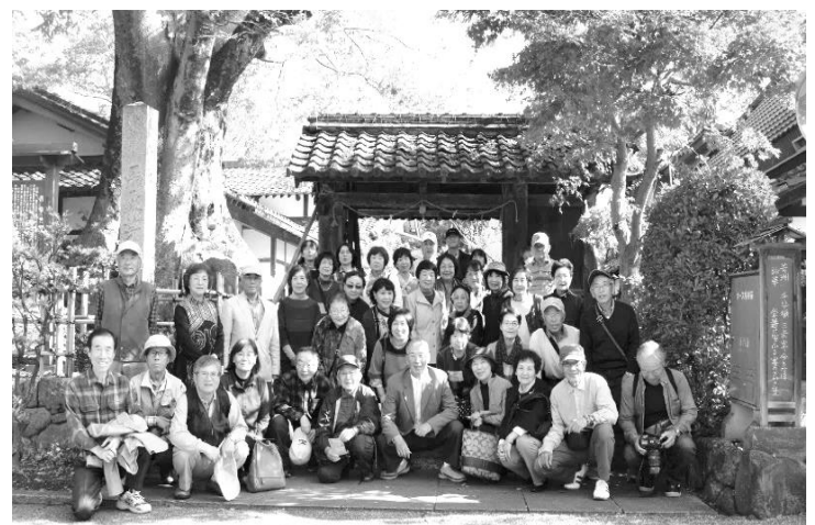
先進地視察研修 雨森芳洲庵 2018.11.08 11:11

ほかに、渡岸寺の十一面観音像や紅葉の鶏足寺、そして繭から生糸を取り出す作業の実演も見学して