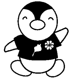
滋賀県民生委員・児童委員キャラクター 「びわっ湖 ミンジャー」

民生委員児童委員には法律で定められた守秘義務があります。ご相談内容の秘密は守られます。心配事を解決するために、福祉制度など様々な支援サービスをご紹介します。必要に応じて、関係団体・機関や福祉サービスとの調整役を務めます。