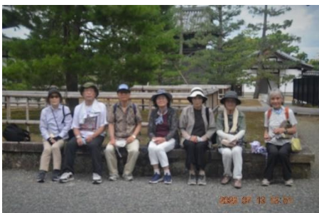
7月13日広隆寺・妙心寺