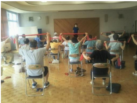
7月20日「セラバンド体操」