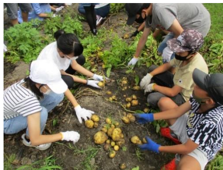
6月20日 6年生「ジャガイモの収穫」