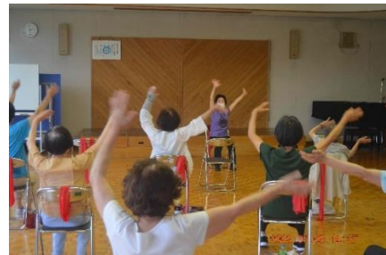
7月6日「音楽に合わせて」