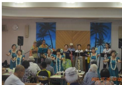
7月26日「ウクレレ・フラダンス」