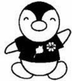
災害時対応型・災害避難キット

9月とはいえ暑さ厳しい毎日でございます。お変わりございませんでしょうか。 今回は、災害への備えについての確認です。 赤ちゃん、高齢者がおられるご家庭等は下記のセットにプラスしてください。 (ミルク・使い捨て哺乳瓶・紙オムツ・杖・入れ歯・補聴器等々必要なもの)。 他にも歯ミガキセット・タオル等の洗面用具類もご用意してください。